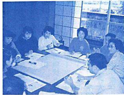
真剣なグループ討議

※この会員研修は、「地域におけるレク指導者の役割」をテーマに過去四回開催してきました。回を重ねるにしたがって、内容も充実、今回は、具体的なレクプログラムを検討段階に入っております。