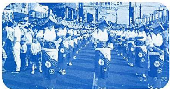
ミス煙草の皆さんによる大パレード 「秦野たばこ祭」

秦野市レク協は昭和三十三年九月に発足し、民踊部・バレエ部・卓球部・体操部・フォークダンス部の五部門千五百五〇名で、市体育協会に加盟し、夫々部門別に事業計画を立て活発に活動して居ります。「五十三国体も目前に迫って来たし、年に一度は会員相互の交流の場がほしい。親睦を深めながら楽しい汗をかきたい」と言う会員からの希望を受け、昨年からは体育大会を実施し、今年は六月三日に開催し、約千人の会員で、賑やかな活気にみちた大会でした。