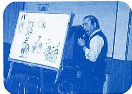
楽しみの一つ パネルシアター

そして、絵と音楽のパネルシアターも私の楽しみの一つ。もちろん、演歌も人生の友達!!