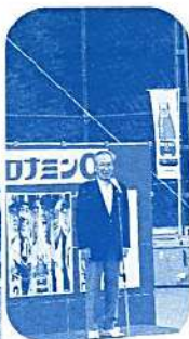
牧田委員長 開会宣言！