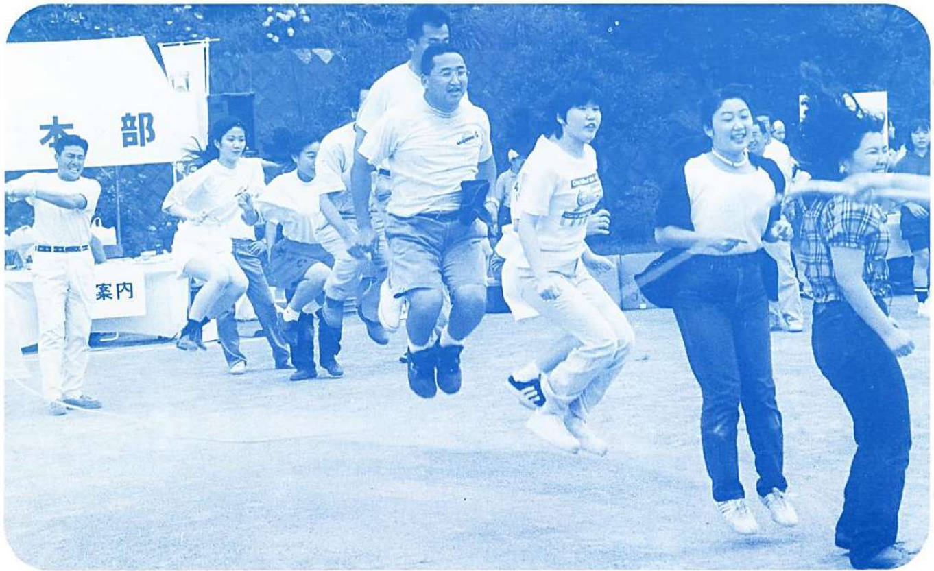
若さで目一杯!! 第9回神奈川県スポーツ・レクリエーション県央大会(7/16 県央体育センター)

現在社会にはいろいろな資格があり、多くの人々がその資格取得を希望している。自分の興味・関心から、仕事上の必要性から、あるいは自分の将来を考えてからなど、それぞれの理由で講習会を受け、試験に挑戦する。時間と費用をかけて資格を取得し指導者となる。指導者となると、その資格をベースに、仲間と連絡を取り合ったり、情報を集めたり、イベントを企画・運営したり、地域や職場等での実践が重要になる。 そんな指導者の必要条件のひとつに、「どれほど動くか」があるのではないだろうか。身のこなし、熱意、親切、哲学、生き方、美学、愛…。それは、いろいろなことに挑戦しながらも、現状に満足せずに悩みながら、やっていることの損得を考えず、今日もまた「汗かき、べそかき、頭かき」の活動を続けている。そんな姿なのではないだろうか。そして私は、周囲から「おもしろい!」と言われる指導者でありたいと思っている。 さて、みなさんは、いかがだろうか。