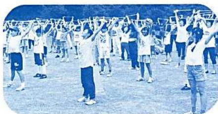
ビートロープ ストレッチング