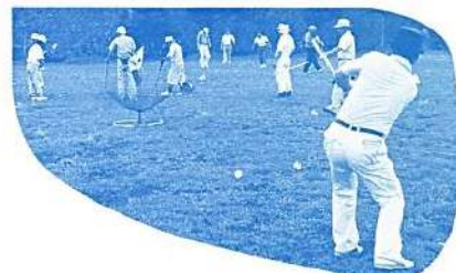
(ターゲット・バード・ゴルフ)

《賀詞交換会》 平成八年一月十九日(土) 以上の事業が予定されています。 お問い合わせは、県レク事務局へ ※バスハイクを平成八年二月に予定 しています。