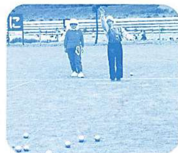
ご夫婦で ナイス/ティール (ベタンク)