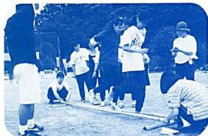
かる〜い ノリで (バンゲー・ダンス)