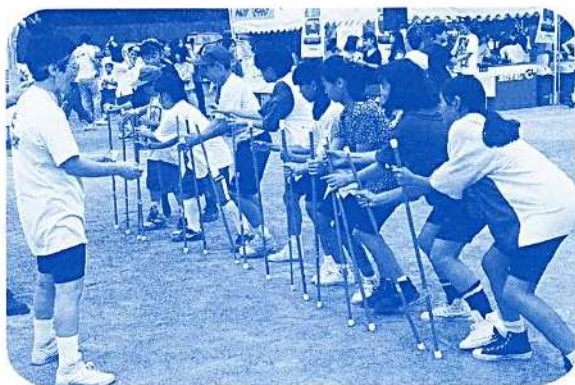
サーーいくわヨ！ セイーノツ おっととと……(キャッチング・ザ・スティック)