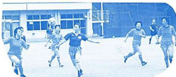
がんばれ〜! おかあさん ストレスの解消に、気晴らしに (ママさんサッカー)