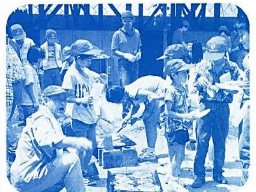
第 16 期「あそびの寺子屋」