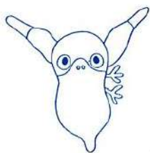
マスコット「かなべえ」

《編集後記》 今年の夏は私にとって、 とても辛い夏でした。私の 大好きな西瓜が、天候不順 で不作と高値というダブル パンチの為、飽きる程食べる前に夏 が終わってしまった事です。でも、 私には「すいか」もあるけど「スコ ール」もあるので、今では、楽しく 編集会議に参加して充実した活動を しております。26号のスコールは、 特別企画の特集保存版として、広報 委員が、知恵、アイデアを出しあっ て取り組みました。ご感想、ご意見 をお寄せ下されば幸いです。 (青木)