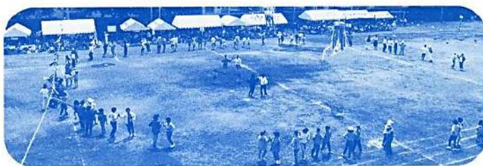
よろこびのワッ、輪、和を広げるフォークダンスの集い

参加者からの「楽しかった、又来年を楽しみにしています」の声に、会員の団結心の強さを感じ頭の下がる思いでした。