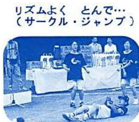
リズムよく とんで… (サークル・ジャンプ)