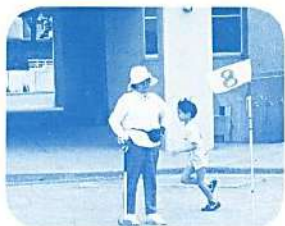
8 番ホール 家族でグラウンドゴルフ バーディーラッシュ!

気楽に楽しみ、気楽に取り組める もちろん誰にでもできます 今人気のバウンドテニス