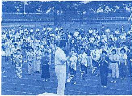
さあ始めよう！ まずは準備体操

6月28日ウォークラリーBコース担当。来場した皆さん、なんとなく入口に並ぶと、そこは、Aコースの受付です。私は、呼び込み屋よろしく、Bコースへどうぞ！と誘いました。二、三、行き違い