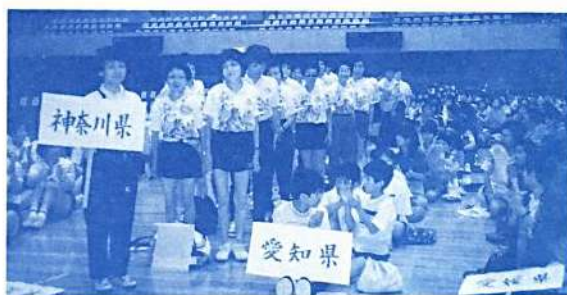
試合を待つラジボール卓球のみなさん