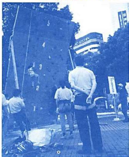
フリークライミングに挑戦