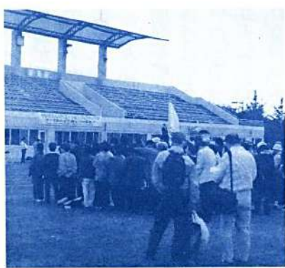
カラフルなユニフォームで 開会式

参加者は受付をすませてから開会式会場へ、カラフルなユニフォームで会場はパッと花が咲いたような華やかさ、全員によるラジオ体操の後にはそれぞれお目当てコーナーへ。参加者のみなさんが、これを契機として更に交流の輪を広げ、県民の生涯スポーツレクリエーション活動の振興に資して下さることを期待します。