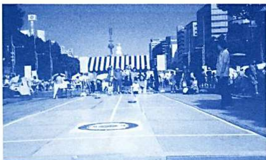
遊びのひろばカローリング

「21世紀の生涯スポーツレクリエーション」を大会テーマに「次代へつなげよう！レク新時代」をスローガンとして、レクリエーションサミットや3種の指導者全国集会など、新しい時代にふさわしいレクリエーション運動の再構築を目指していく大会となりました。