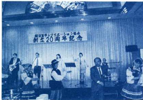
創立20周年記念式典

レクリエーションいっつもどこでもだれとでも、をモットーに、レク関係6団体がそれぞれの特徴を十分に發揮させて、三浦半島域でレク運動を積極的に進めています。 戦後間もなく、アメリカ人の教会牧師からスクエアダンスのレコードを使ってみたいかと進められて、活動を始めた横須賀市のレク活動は、以来、大勢の市民に親しまれ、仲間づくりに健康づくりに、そして明るい地域