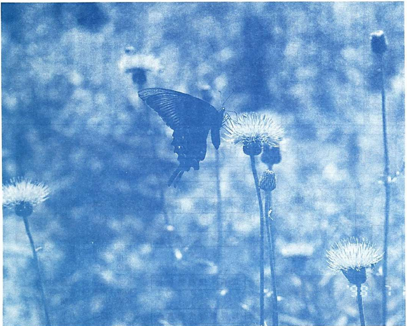
初秋の高原を訪れて……。