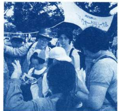
ウォークラリー大会

レクリエーションいっつもどこでもだれとでも、をモットーに、レク関係6団体がそれぞれの特徴を十分に發揮させて、三浦半島域でレク運動を積極的に進めています。 戦後間もなく、アメリカ人の教会牧師からスクエアダンスのレコードを使ってみたいかと進められて、活動を始めた横須賀市のレク活動は、以来、大勢の市民に親しまれ、仲間づくりに健康づくりに、そして明るい地域