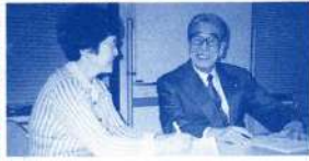
和やかな雰囲気 でインタビュー 情報委員長

今や日常生活化しているレクリエーションを通して、県民の為に役に立つ協会として、会員と共に力と知恵を合わせて実績を積み上げたい。 二十一世紀の県レクのあるべき姿は？