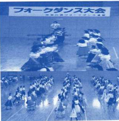
フォークダンス大会にて

神奈川県フォークダンス連盟は、フォークダンス・スクエアダンス・民謡の三組織により構成されている団体です。 今回は、明るく・楽しく、みんな仲良く・人の輪・人の和・老若男女を問わず多くの人々に愛好されているフォークダンス部門の活動を紹介します。 フォークダンス部門の加盟団体は80団体あり、各団体は学校の体育館、公民館等の施設を活動の場として普