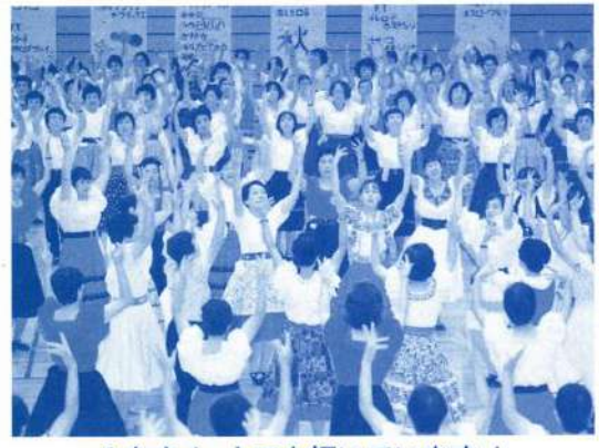
みなさん とても輝いています!