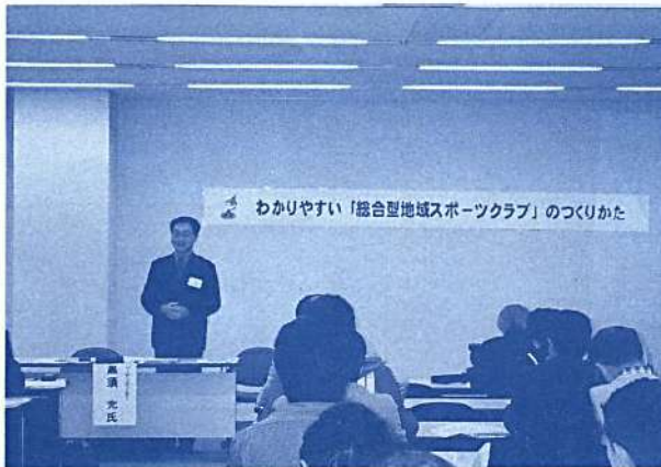
第55回全国レクリエーション大会 ・期日 平成13月10日26日～28日 ・会場 香川県高松市

最終日、閉会式の雨は全国大会の別れを惜しむ涙雨のようだったが、群馬県から来年の開催地香川県へつなぐエンディングステージ「時代」の合唱で会場と一体感となり大会の幕はおりた。