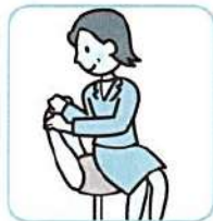
軽いツイストで腰をスッキリ。無理をせずに軽くゆっくり。

疲労がたまっている筋肉は、緊張状態が続くことで、中枢神経にストレスがたまります。