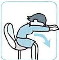
椅子を使って、肩から胸を伸ばす