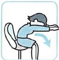
体をゆっくり前にたおす。