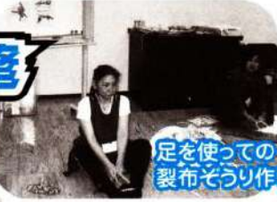
足を使っての 裂布ぞうり作り