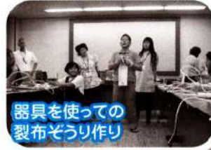
器具を使っての 裂布ぞうり作り