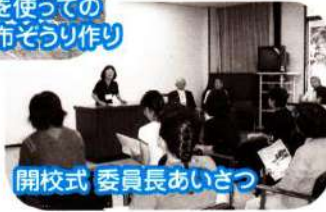
開校式 委員長あいさつ