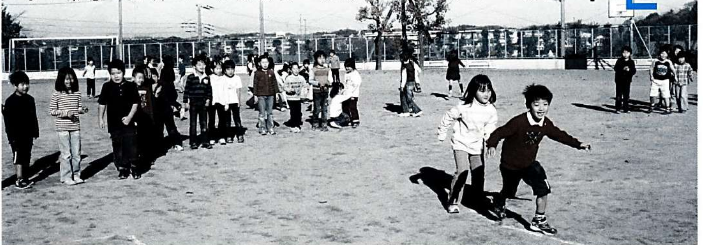
外遊び講座で元気いっぱいの子どもたち (横浜市内小学校)

創立50周年記念事業として、記念式典・記念誌の発行・3回目の本県開催となる「第61回全国レクリエーション大会INかながわ」を実施します。