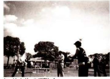
ターゲットボールで楽しく