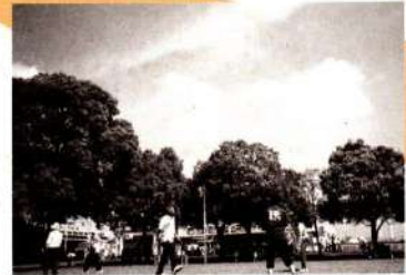
ラリーが楽しいインディアカ