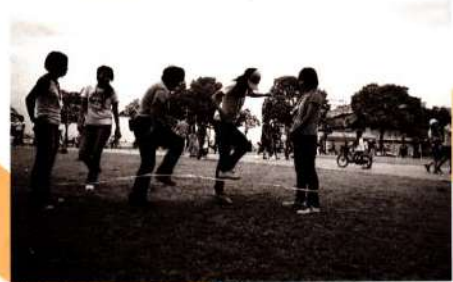
縄飛び?(ゴムです)チャレンジ・ザ・ゲーム