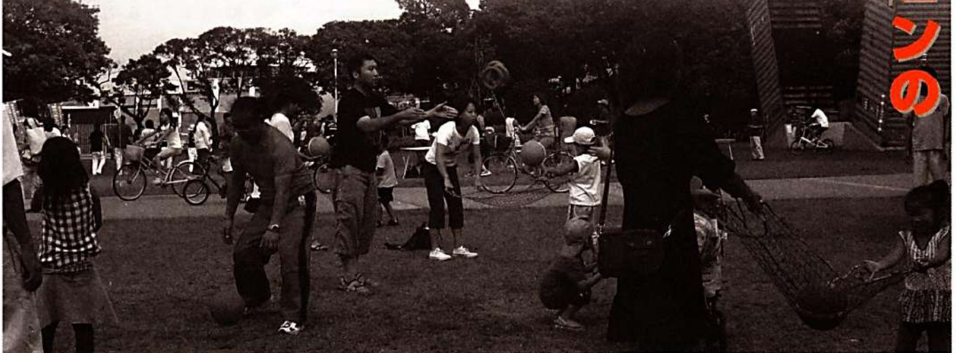
親子でチャレンジ・ザ・ゲームを楽しむ (山下公園)

最後になりましたが、今後とも本県のスポーツ・レクリエーションの振興に御協力をいただきますようよろしくお願いいたします。