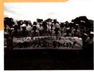
全国大会で会いましょう

次は11月2日(金)から4日(日)の第61回全国レクリエーション大会INかながわで会いましょう! まってま〜す!