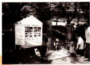
ネイチャーゲームで自然と楽しく