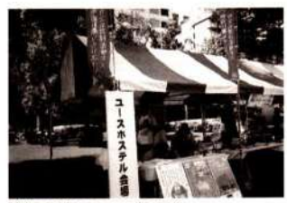
訪ねてみたいユースホステル

横浜マリンタワーのもと、ランドマークや氷川丸をロケーションに会員はもちろん一般参加者も交え、みんなでフォークダンスや民踊で“wa”踊り。楽しいひと時を過ごしました。