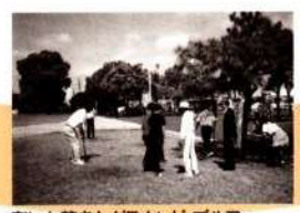
老いも若きもグラウンド・ゴルフ