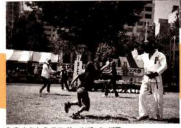
心身をきたえるスポーツチャンバラ