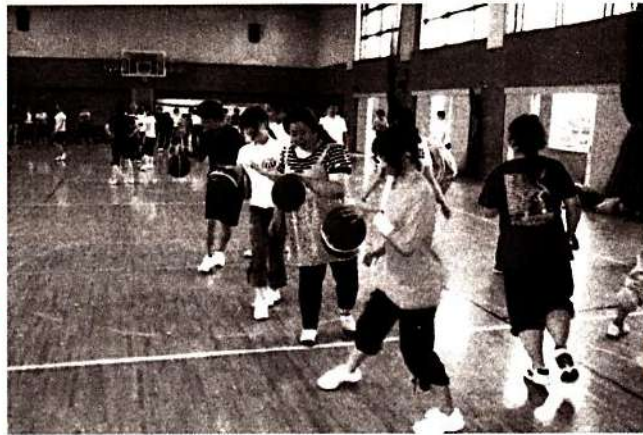
ドリブル・リレーで記録に挑戦!