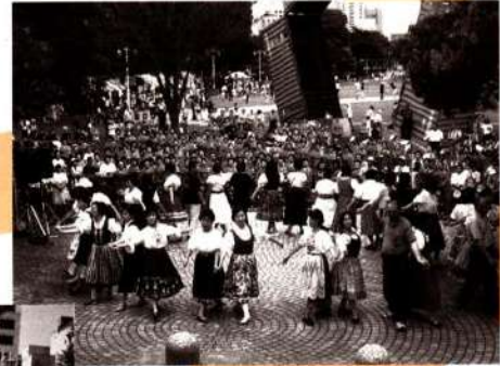
フォークダンスのデモンストレーション