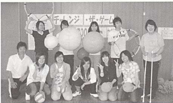
遊びが先か 運動が先か それがチャレンジ・ザ・ゲームだ！ 「チャレンジ・ザ・ゲーム 2008 in かながわ」 於：県立スポーツ会館 (6/28)