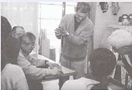
平成19年度研修会「火おこし」 於：グッティハウスはたの

研修会として、昨年は「火おこし」を実施。今年の秋には、落語家からの「話術を学ぶ」を計画しています。