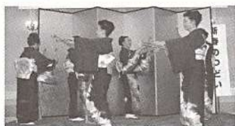
チャッキラコ(三浦市)