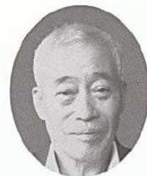
神奈川県体育指導委員連合会