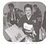
ネエ〜アナタ 当たったわヨ!