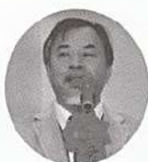
(来賓) 浅野日レク常務理事