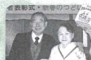
大きな箱物ですヨ アナタ… 左手はおまけ? (理事長賞)