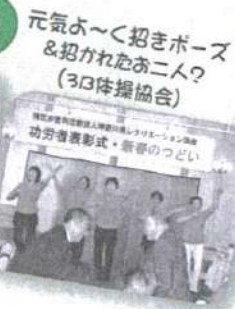
元気よく招きポーズ & 招かれたお二人? (3日体操協会)