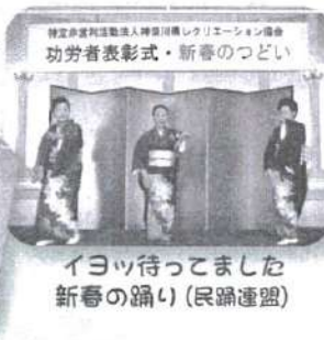
イヨッ待ちました 新春の踊り(民踊連盟)