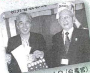
エッほんと!?(会長賞)