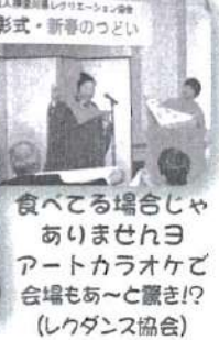
食べてる場合じゃ ありませんヨ アートカラオケで 会場もあ〜と賑き!? (レクダンス協会)