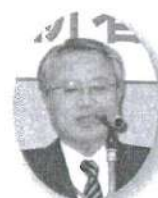
県体協 駒形事務局長(来賓・乾杯)