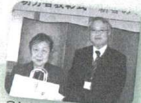
アタ! タカシマヤの袋ヨ (県体協賞)