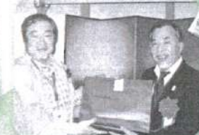
ゲットしちゃいましたヨ ウフッ! (日レク協会賞)