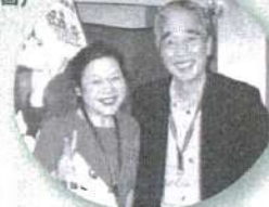
おもわずキョキしちゃったヨ (事務局長賞)