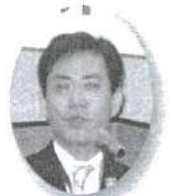
県スポーツ課 柿木副課長(来賓)