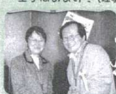
うれしさも押さえるこ こ〜んな顔です (副会長賞)