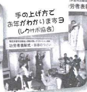
手の上げ方で お年がわがいきますヨ (レクサボ協会)