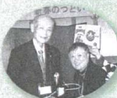
あなた! 当たったのヨ (副会長賞)