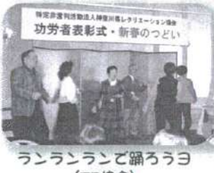
ランランランで踊ろうヨ (FD協会)