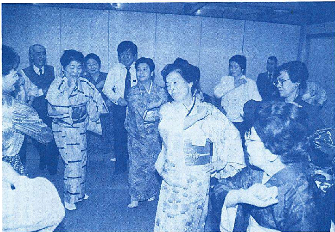
熱演「一円玉の旅がらす」(1991. 1. 27 会員交流会)