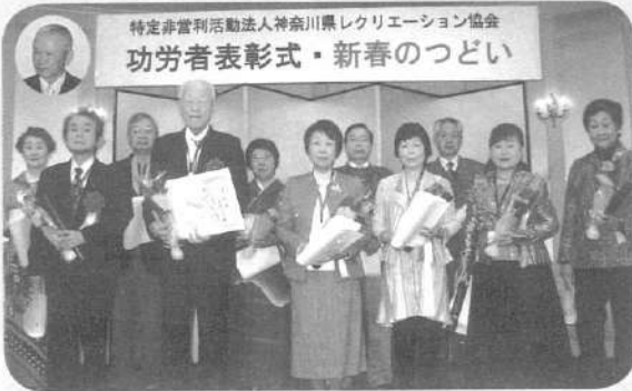
特定非営利活動法人神奈川県レクリエーション協会 功労者表彰式・新春のつどい